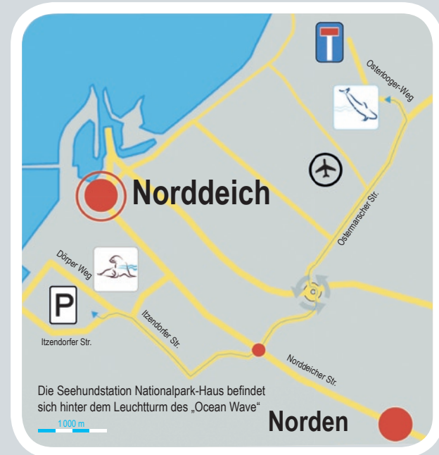
Die Seehundstation Nationalpark-Haus befindet sich hinter dem Leuchtturm des „Ocean Wave“