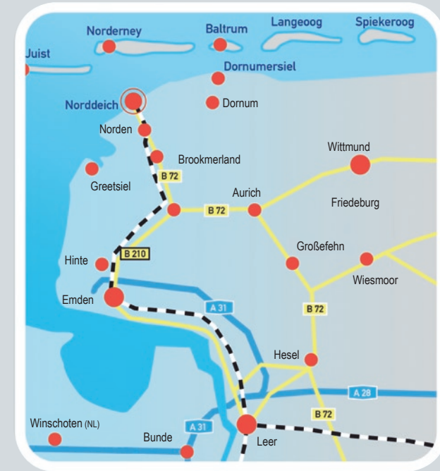
Ihr Weg zur Seehundstation und zum Waloseum