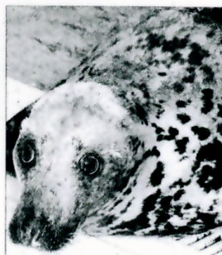
Eine erwachsene Kegelrobbe.

Die Kegelrobbe ist das größte freilebende Raubtier Deutschlands, sie wird bis zu 300 Kilogramm schwer. Der Kopf hat eine kegelartige, längliche Form. Die Männchen haben ein dunkles Fell mit hellen Flecken, während die Weibchen hell mit dunklen Flecken sind. Jungtiere kommen mit weißem Fell zur Welt.