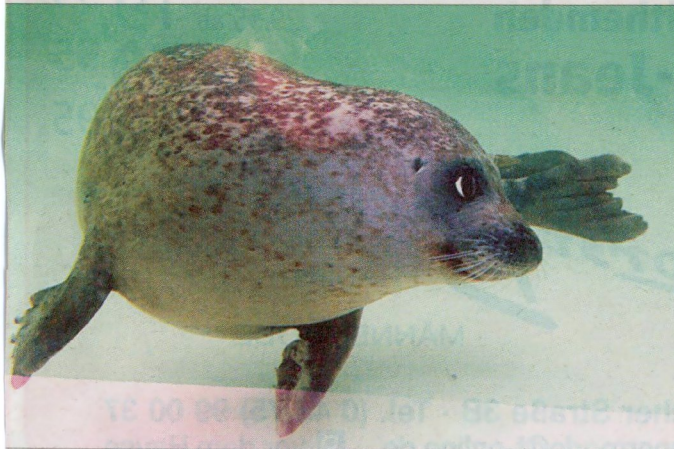
Na? Wie findet ihr mich?