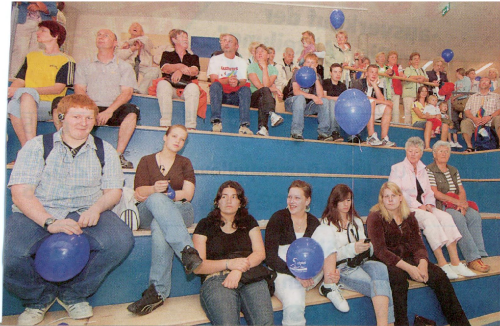
In dem so genannten Amphitheater sitzen die Besucher in der ersten Reihe und haben einen tollen Blick auf die Unterwasserwelt der Seehunde und Kegelrobben in der Station.