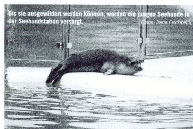
Bis sie ausgewildert werden können, werden die jungen Seehunde in der Seehundstation versorgt.

nanziert werden die jährlichen Flüge aus den Jagdabgabemitteln der niedersächsischen Jägerinnen und Jäger. Fi.