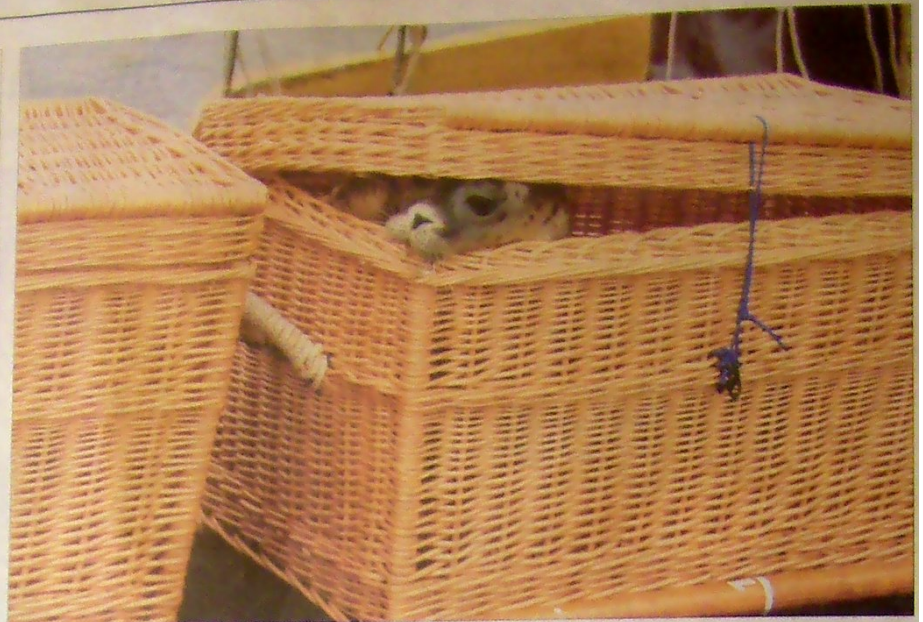
Neugierig lugt ein Seehund aus seinem Korb hervor. Noch ein paar Minuten muss er sich gedulden, dann wird er frei sein. Durch einen Transponderchip kann die Seehundaufzuchtstation aber weiter verfolgen, wo sich das Jungtier aufhalten wird.