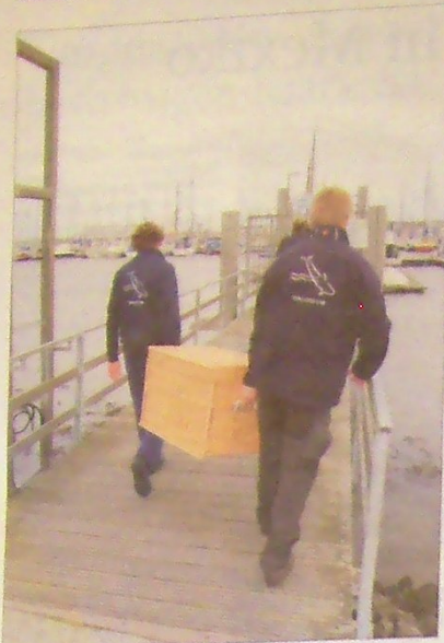
30 Kilo schwere Last: Die Seehunde werden an Bord des Schiffes Plumbum gebracht und zur Insel Juist gefahren.